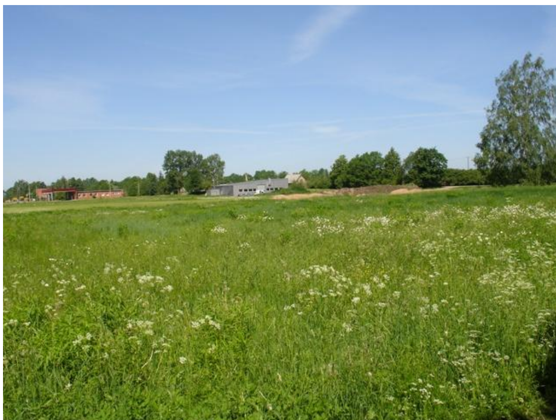
Улица Аболу 3