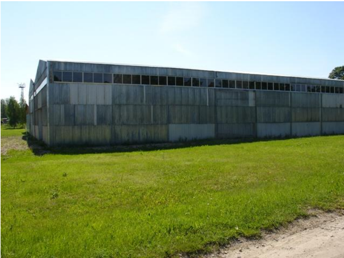
Улица Калькю 12