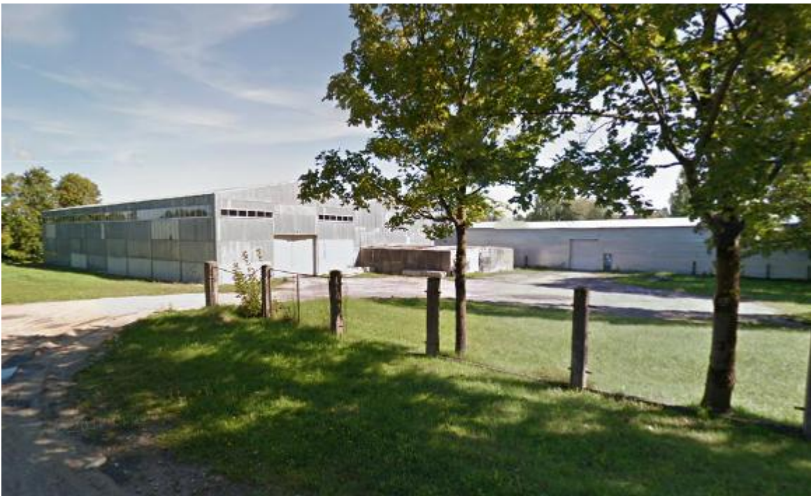
Улица Калькю 12