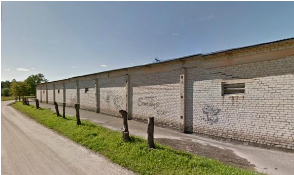
Улица Калькю 3