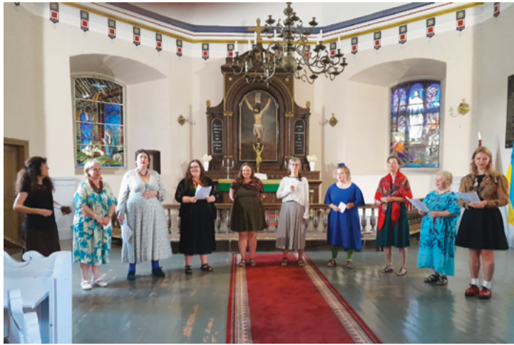
Attēlā: Noslēguma koncertā Āraišu baznīcā tradicionālās dziedāšanas entuziasti rādīja, ko apguvuši, muzicējot meistarklasēs.