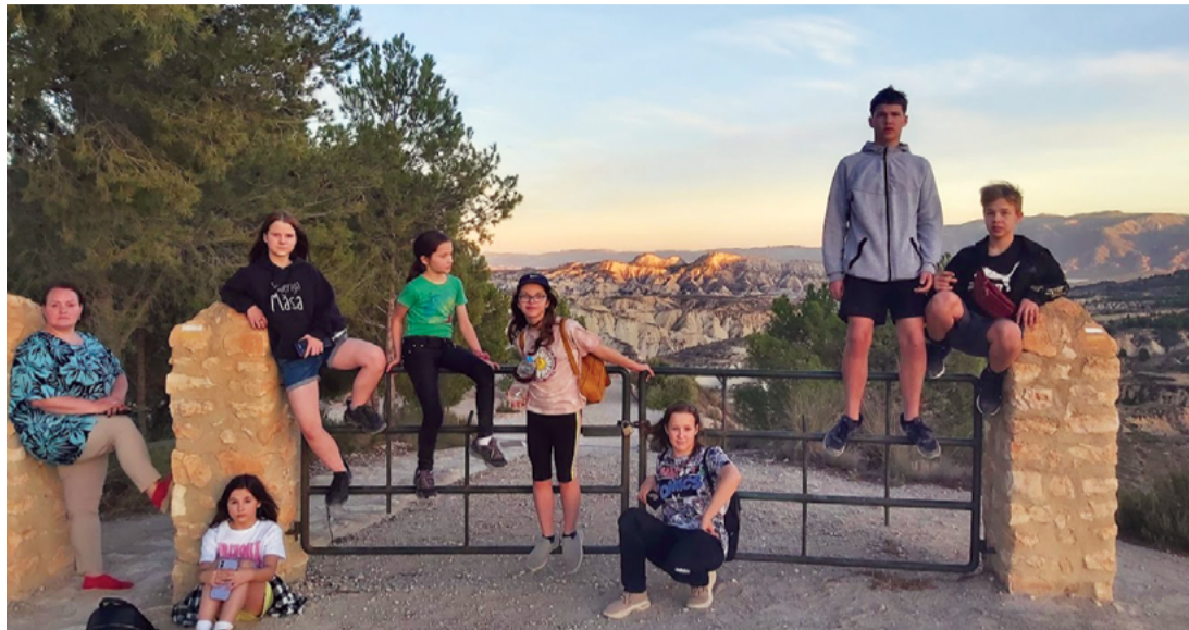
Attēlā: Skujenes pamatskolas audzēkņi un pedagogi aizraujošos ceļojumos uz Spāniju, Grieķiju un Portugāli iepazīna Eiropas dabas daudzveidību.

Pirmā septiņu skolēnu vizīte notika decembrī Spānijā, Mursijas reģionā, sešu skolu