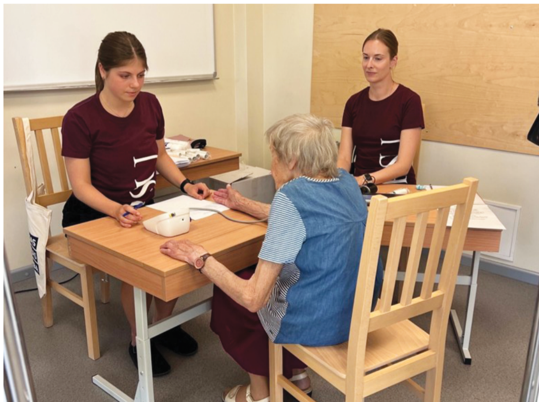
Attēlā: Antropoloģiskās izpētes projektā nomēriti piebaldzēni vecuma amplitūdā no pusotra līdz 99 gadiem.

Pētījuma dalībniekiem īpaša interese bija par attēliem, ko skenēja inovatīvā uzņēmuma "CastPrint" speciālisti.