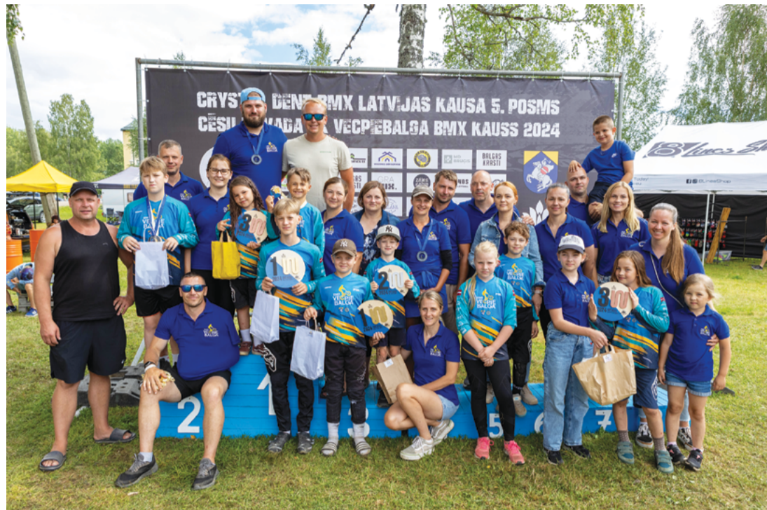
Attēlā: Vecpiebalgas jaunie BMX sportisti un viņu jaudīgā atbalsta komanda var būt gandarīta par sekmīgu startu Latvijas BMX un "SK Vecpiebalga" kausu izcīņā.

Latvijas kausa posmā ar savu klātbūtni pagodināja šī gada pasaules un Eiropas U23 čempione, Parīzes olimpisko