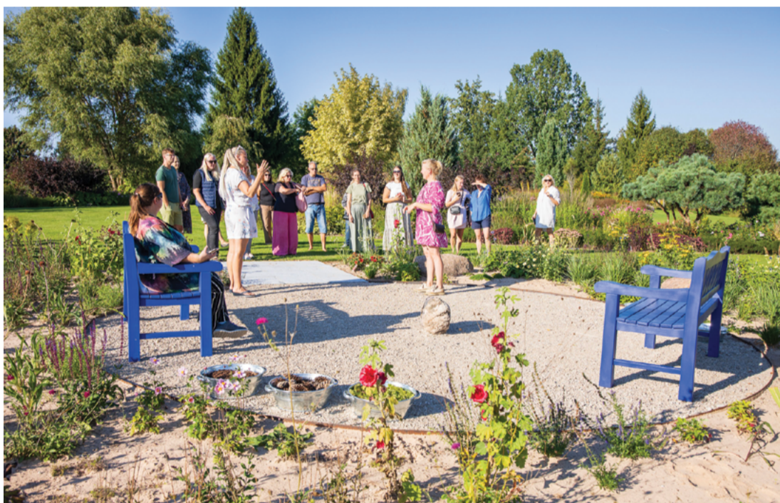
Attēlā: Projekta gaitā nākamajā vasarā uzlabos Lielstraupes pils ārtelpas infrastruktūru, pils pagalmā izlīdzinot bruģi un ierīkojot gājēju celiņu un atpūtas vietu.

Septembra sākumā Dienvidgaunijā tikās Igaunijas–Latvijas pārrobežu sadarbības projekta "Dārza Pērles ikvienam" partneri, lai apspriestu projekta īstenošanas gaitu un klātienē iepazītos ar piedāvājumiem pieejamības risinājumiem Palusalu dārzā, Rēpinā, veidojot atpūtas un izglītošanas telpu. Partneri kopīgi izvērtēja, vai izvēlētais laukuma segums ir piemērots ratiņkrēsliem un bērnu ratiņiem, vai atpūtas vieta nav pārāk izsaulota, kā arī, galvenais, vai mērķauditorija ir uzaicināta testēt šo laukumu. Pēc tam sekoja Mikko saimniecības "Sirds dārza" apskate, kurā ierīkotas dabīgas atpūtas zonas