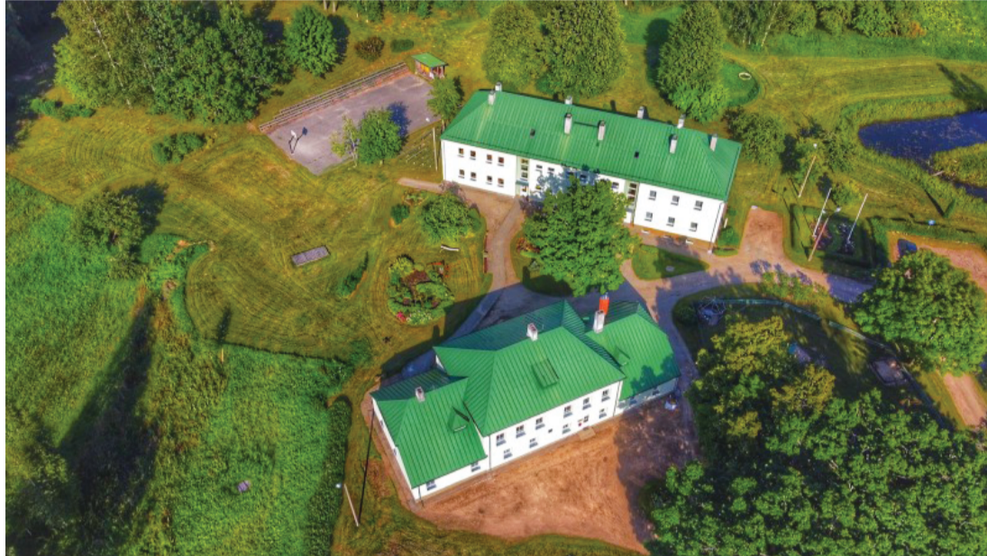
Attēlā: Apstiprinātais attīstības plāns palīdzēs Rāmuļu skolai sekot izvirzītajiem mērķiem, apliecinot arī pašvaldības interesi un atbalstu.

“Apstiprinātais attīstības plāns palīdzēs skolai sekot izvirzītajiem mērķiem, apliecinot arī pašvaldības interesi