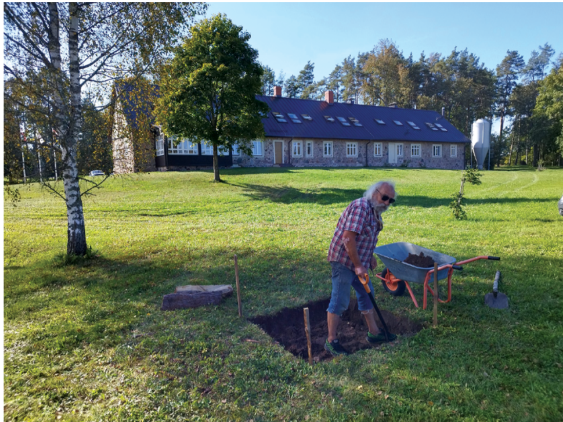
Attēlā: Projekta īstenošana sāksies ar ceplja mūrēšanu un meistarklasi, kas notiks oktobrī.

Projektu finansiāli atbalsta VKKF mērķprogramma "Latviešu vēsturisko zemju attīstības programma" un Vidzemes plānošanas reģions.