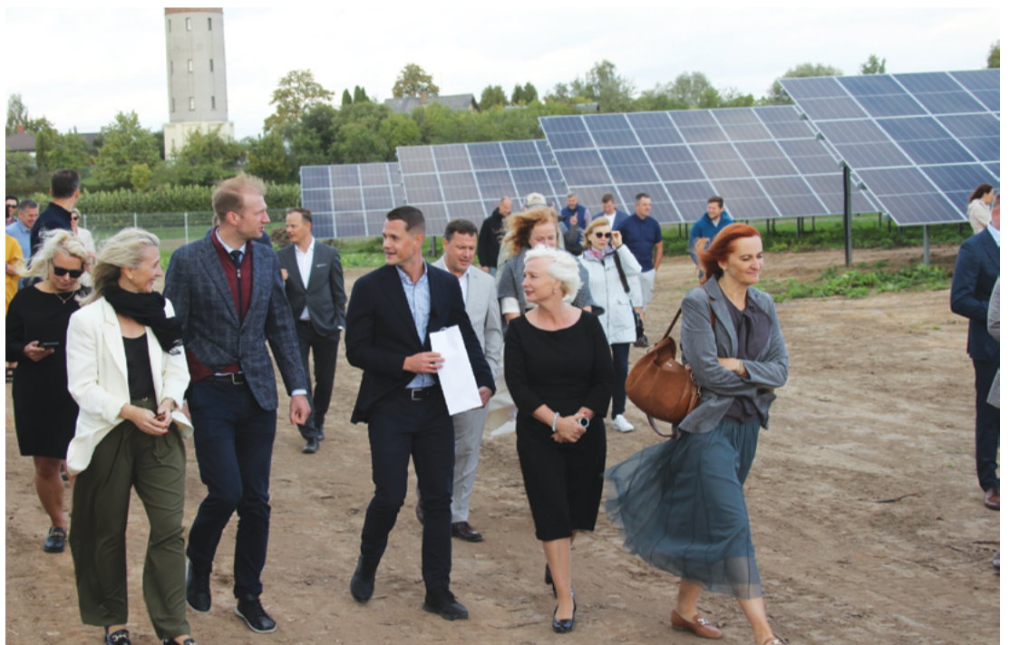
Attēlā: Saules parka atklāšana noslēdzās ar ekskursiju pa tā teritoriju.