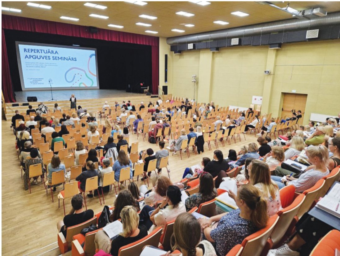
Attēlā: Cēsu novada bērnu un jauniešu deju kolektīvu vadītāji vasaras nogalē divu dienu seminārā sāka XIII Latvijas Skolu jaunatnes dziesmu un deju svētku repertuāra apguvi.

Cēsu novada bērnu un jauniešu deju kolektīvu vadītāji vasaras nogalē pulcējās Rīgā, lai divu dienu seminārā sāktu repertuāra apguvi un precizēšanu XIII Latvijas Skolu jaunatnes dziesmu un deju svētkiem. Kolektīvu vadītāju priekšā liela izvēle un atbildība, jo šajos svētkos būs iespēja piedalīties trijās deju programmās – deju koncertā Daugavas stadionā “Es atvēru Laimas dārzu”, deju uzvedumā, kas notiks “Arēnā Rīga”, kā arī noslēguma