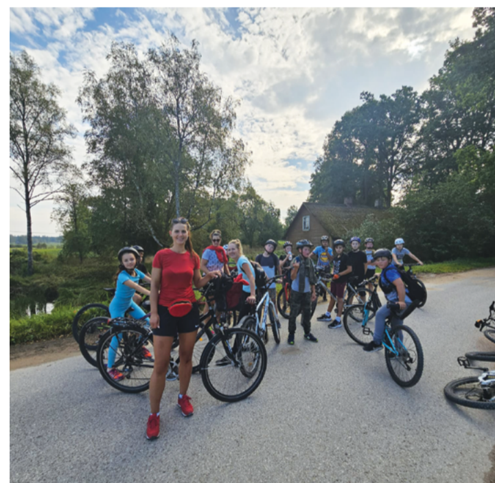
Attēlā: Mobilitātes nedēļā Zaubes skolēni un viņu vecāki velobraucienā izzināja dzimto pusi.

Septembrī visā Eiropā norisinājās mobilitātes nedēļa, kas popularizē velosipēdu izmantošanu. Arī Zaubes pamatskolas skolēni, viņu vecāki un vecvecāki piedalījās velobraucienā-pārgājienā "Izzini Zaubi!". Tiem, kas vēlējas pārgājienā braukt ar riteni, tika piedāvāti divi braukšanas maršruti ar uzdevumiem atbilstoši skolēnu vecumam un