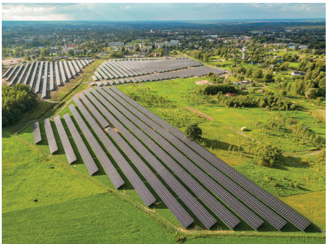
Attēlā: Saules elektrostacijas teritorijā 23 hektāru platībā izvietoti vairāk nekā 33 500 saules paneļu. Publicitātes foto.