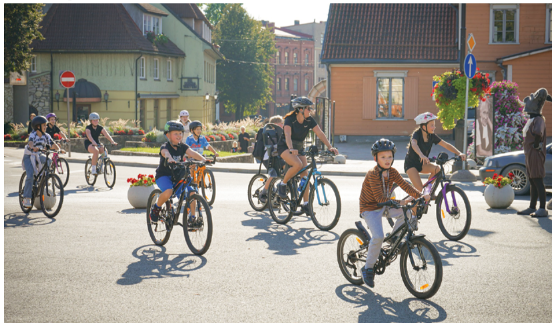
Attēlā: Ap simts “Mobilitātes nedēļas” brauciena dalībnieku devās pilsētas ielās, lai popularizētu videi draudzīgu pārvietošanās paradumus.

Ik gadu septembrī norisinās Eiropas mobilitātes nedēļa. Tās mērķis ir veicināt videi draudzīgu pārvietošanās paradumus. To atzīmējot, septembrī aktīvie riteņbraucēji bija aicināti pulcēties pie Cēsu sporta kompleksa, lai dotos “Mobilitātes nedēļas” braucienā pa pilsētas ielām.