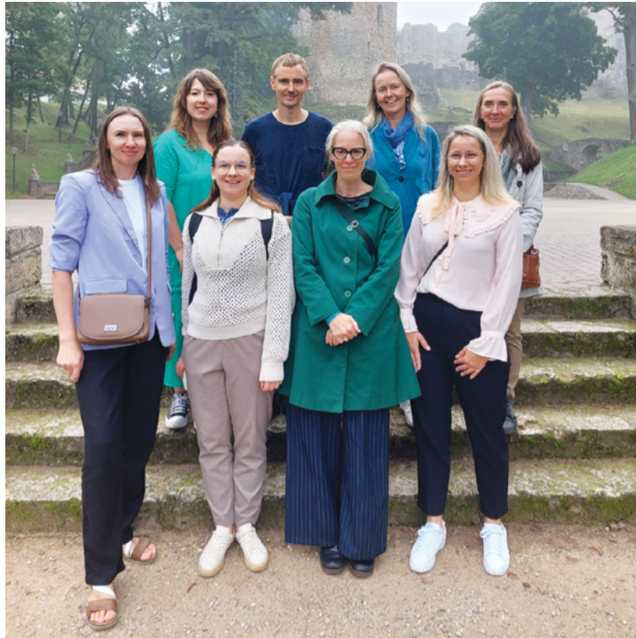
Attēlā: Domnīcas eksperti atzina, ka "Pērles" apkārtējai teritorijai ir liels potenciāls, tikai nepieciešami ieguldījumi, lai idejas īstenotu.