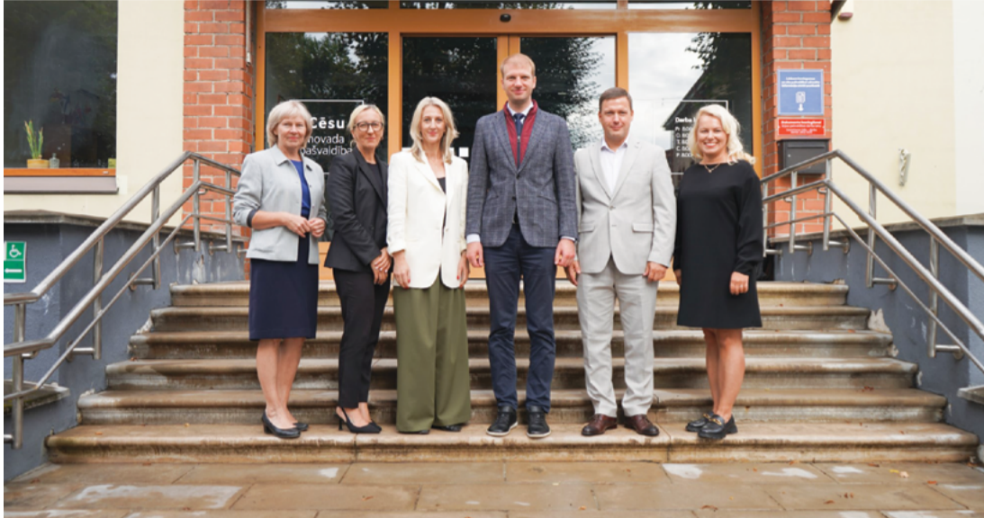
Attēlā: Cēsu novada pašvaldībā klimata un enerģētikas ministrs Kaspars Melnis ar pašvaldības vadību un speciālistiem. Pārrunātas atjaunojamās enerģijas ražošanas attīstības tendences valstī.

Septembra nogalē oficiālā vizītē Cēsis viesojās klimata un enerģētikas ministrs Kaspars Melnis. Vizītes laikā ministrs tikās ar Cēsu novada domes vadību, pašvaldības speciālistiem un novada uzņēmējiem, lai pārrunātu klimata un enerģētikas nozaru aktualitātes. Tāpat ministrs viesojās Kosmosa izziņas centrā, kā arī notika sarunas ar SIA "Vinda" un SIA "Adven Latvia" vadību.