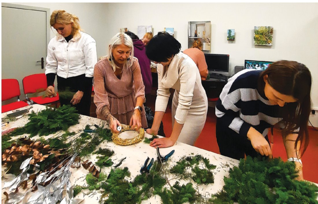
Attēlā: Meistarklases kļuva par skaistu piedzīvojumu, kurā valdīja krāsu un domu lidojums.