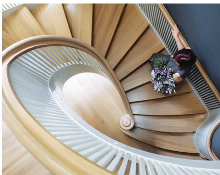
Attēlā: Pašreizējo izskatu viesnīca "Villa Santa" ieguva 2017. gadā, kad jaunie īpašnieki pārbūvēja vecās ēkas līdz pamatiem, saglabājot villu vēsturisko apjomu.

Tagad piecu hektāru lielajā teritorijā atrodas trīs dzīvojamās villas, kurās izvietoti 30 luksusa klases dizaina numuri, spa un restorāns. Īpaša ir "Tilta Māja" – unikāla būve, kas