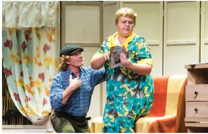
Attēlā: Novada amaterteātru skatē piedalījās seši amaterteātru kolektīvi no Cēsīm, Jaunpiebalgas, Veselavas, Taurenes, Mārsnēniem un Straupes.

▪ Mārsnēnu amaterteātra izrāde "Kazlauckus savu darbu prot" (E. Vulfis). Režisore