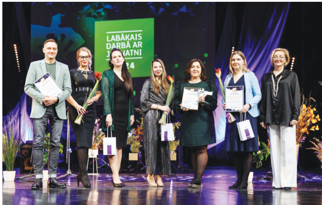
Attēlā: Šogad konkursa "Labākais darbā ar jaunatni 2024" gaitā īpaši uzsvērtā dažādība un radošums jaunatnes jomā.

Decembra sākumā konkursa "Labākais darbā ar jaunatni 2024" svinīgajā ceremonijā Cēsu novada pašvaldība godināta par izciliem sasniegumiem jaunatnes darbā, iegūstot nomināciju "Līdzdalības stiprinātājs".