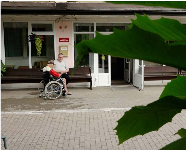
ReTV: Cēsu pansionātam – 30