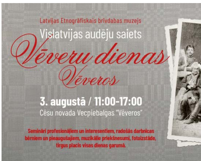
LR1: Notiks pirmais Vislatvijas audēju saiets "Vēveru dienas Vēveros"