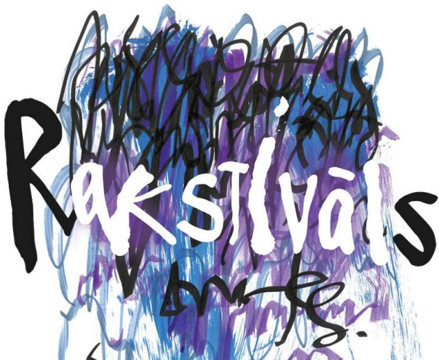
LTV: Aizvadīts pirmais rakstišanas festivāls "Rakstivāls"