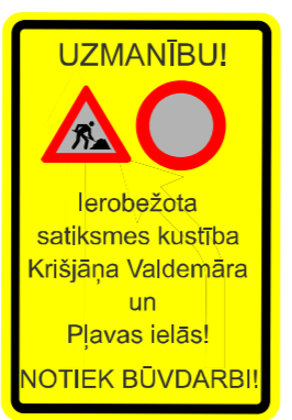
- Brīdināošs informatīvs plakāts