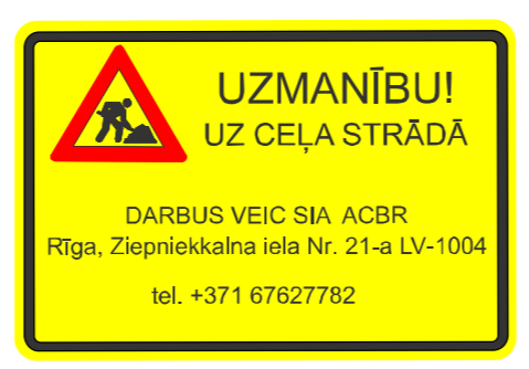
- Būvniecības brīdinājuma plakāts