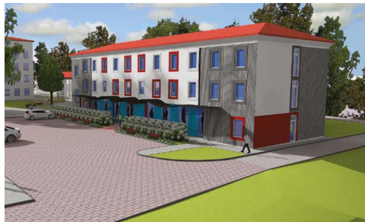
Attēlā: Topošās Vidzemes Tehnoloģiju un dizaina tehnikuma dienesta viesnīcas vizualizācija.