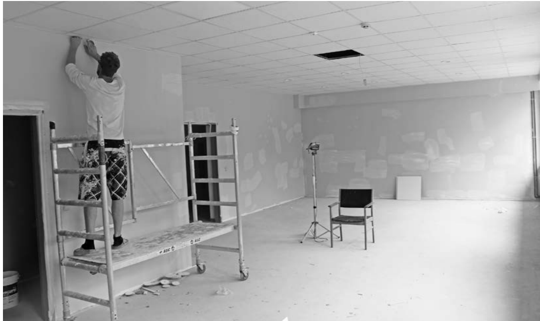
Attēlā: Topošajās grupu telpās jau norit telpu apdares darbi.

Rindu mazināšanu uz vietām pirmskolas izglītības iestādēs ir pašvaldības šī gada prioritāte. Līvu sākumskola tagad kļuvusi par pirmskolas izglītības iestādi. Pavasarī sākās būvdarbi, lai līdz septembrim skolas ēkā izbūvētu labiekārtotas telpas trim bērnudārza grupām.