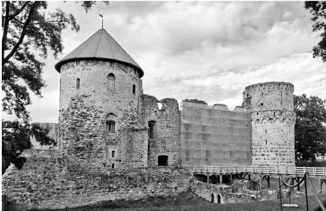
Attēlā: Divus gadsimtus ilgajā Cēsu pils saglabāšanas darbu vēsturē šobrīd piedzīvojam plašākā apjoma pils konservāciju.

Liela apjoma mūru konservācijas darbi tiek īstenoti arī pils austrumu un dienvidu korpusos, kā arī pils kapelā un dienvidu tornī. Kopš pagājušā