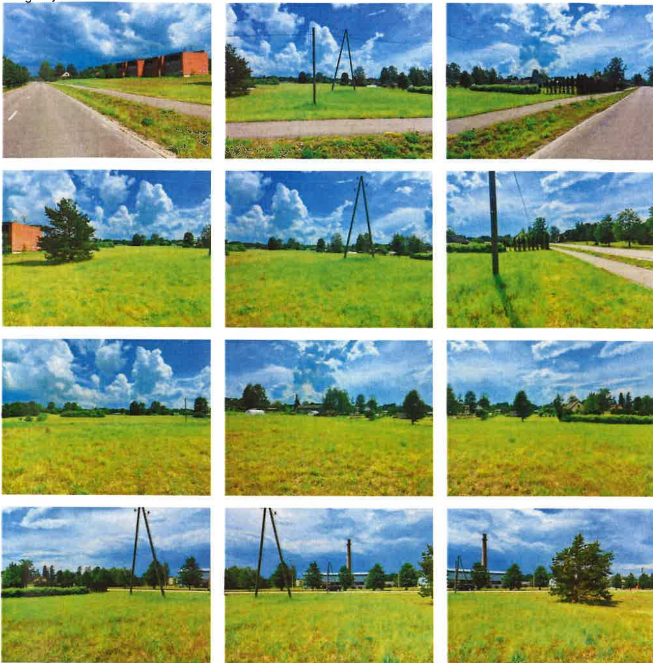
Zemes vienība ar kad.apz.42580060320 – 0,2065 ha