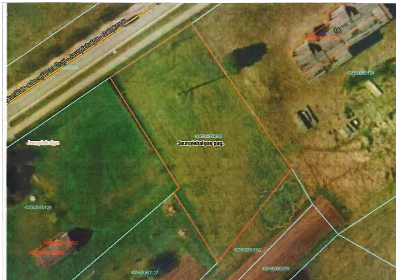
Zemes vienība ar kad.apz.4256 006 0380 – 0,2065 ha