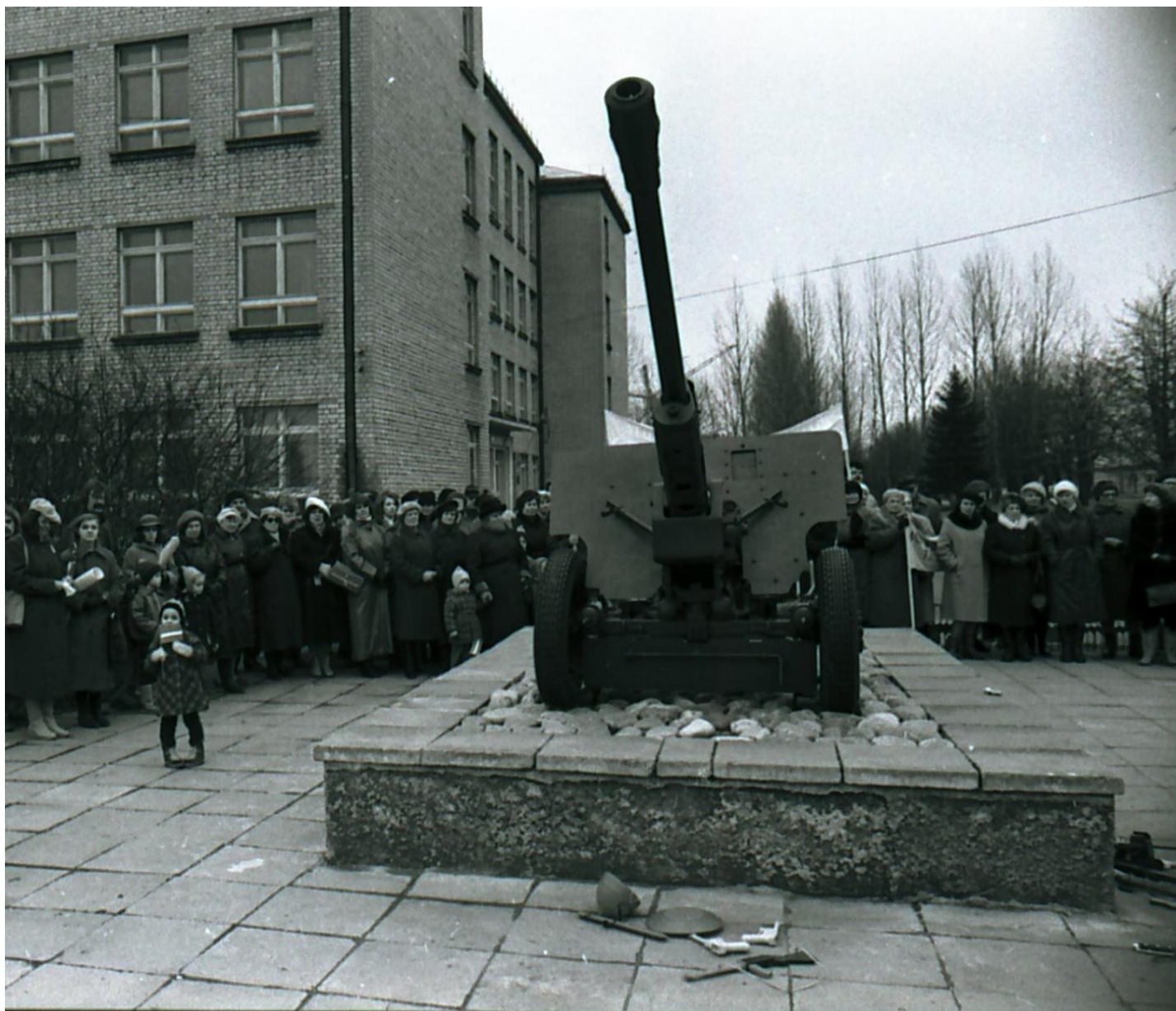
Mītiņš "Pret ieročiem - rotaļlietām" pie Cēsu 2.vidusskolas, 1990.gada 8.martā.