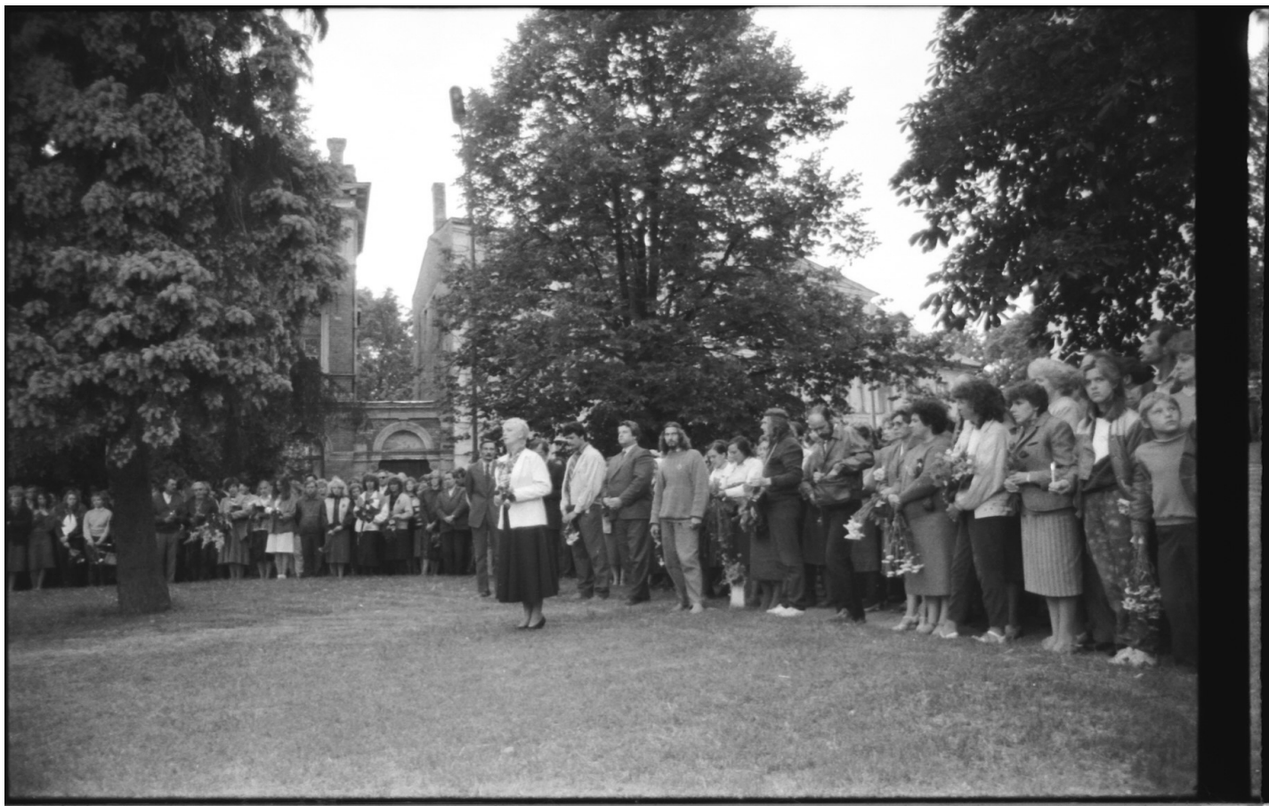
1988.gada 14.jūnijā visi kopā – pirmajā padomju varas atļautajā piemiņas dienā no Latvijas izsūtītajiem iedzīvotājiem. Cēsis, Rožu laukumā.