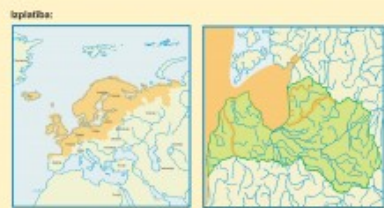
Latvijā laši regulāri nērdā 9 upēs - Salacū, Vīrupē, Agā, Pērnāpē, Gaujā, Irbē, Vēnē, Ūzavē, Tērd un atvērtāsīs to pērnās.

Latvijas laši uz jūru dodas apmēram 2 gadu vecumā, sasniedzot 11-18 cm garuma. Nokļūst jūrā, kām sāmē ātrāji augi un atvērties par lašu zivi. Tos parasti baroja pa vienu, galvenokārt ar zivīm (īvēdājām, reģeļām, vārdādā sāgām un c.). Latvijas lūvāms laši barojušis migrē pa visu Baltijas jūru, ieskaitot Somu un Botnijas lūvu, kā arī Bostholmas salas rajona, bet galvenā barošānā apgabala ir Baltijas jūras centrālā baseina dienvidu daļa (lūvā: Polijas lūvāms), kur vīvērtīet barojušis vārdukūms visas Baltijas jūras lūvāms laši. To ārpēd no dienvidu upes līdz gal. 600 km mērnem lūvu. Jūrā tas uzturās 1,5-5 gadiem. Sāmēdēt ātrāru lašu, šēm iesājis dāmārgatā. Pērnā tas notiek 2-7 gadu vecumā, sāmēdēt 40-85 cm garumā. Tād lūvā ātrāris sāmēdēna upēs, lai nērdā. Lašu sāmē dzīves laikā nērdā 1-3 reizes. Lašu dzīves ilgums ir apmēram 8-9 gadi, bet var sāmēgē 15 gadu vecumā.