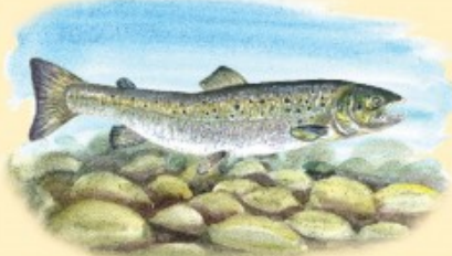
Atlantijas lais (Salmo salar) ir liels izmēra lašu dzimtas (Salmonidae) zivs. Laša dabīgais izplatības areāls ietver arī Baltijas jūru. Baltijas jūrā sastopami laši tikai nēros gadījumos kasnotāti ar Ziemeļjūras daļu.

Laši ir anadroma zivs, kas nozīmē, ka lielāko daļu sava mūža tas pavadījis siltā, bet vārdoles dāzda izvērtēšanas siltā ūdeņā. Laši ir siltdaū, ar mēdzādu no siltiem saspārdājam bērēm. Māte ar saimē un ķermeņa zobēm, kas vārdi uz priekšu. Kā visām lūvēdīgajām zivīm tam ir baltspārns. Rokotājā pazīmē – augliskājam gādā sīvēdēs līdz āca izņemumājām mājā. Laša mugura ir zāģaini vai zāģaini paškā, sām un vēderā sūrdabāms. Uz sāmē, galvenokārt visi sāmē ūdeņā, nēsi e-veidā, mēsi plankumīgi. Uz muguras spuras parasti nav plankumīgu.